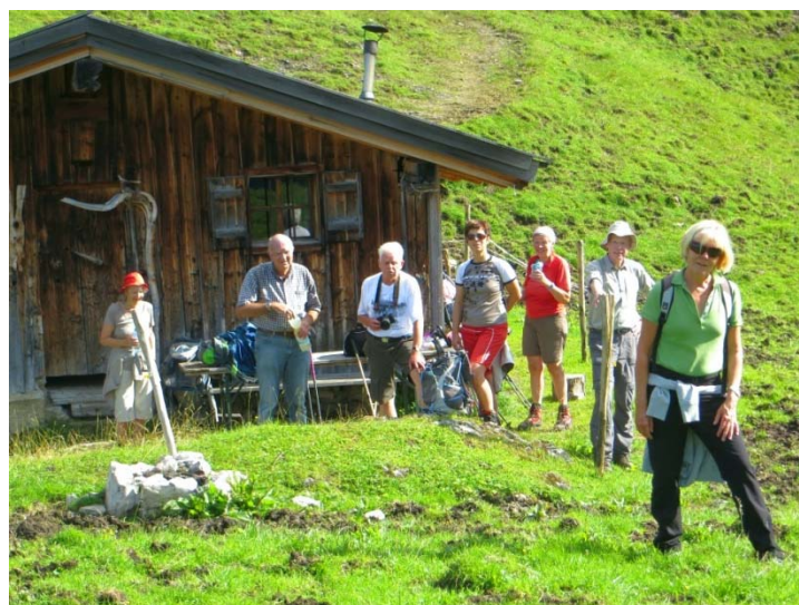
Tagestour Hochlandhütte (Karwendel) am 18.09.2016