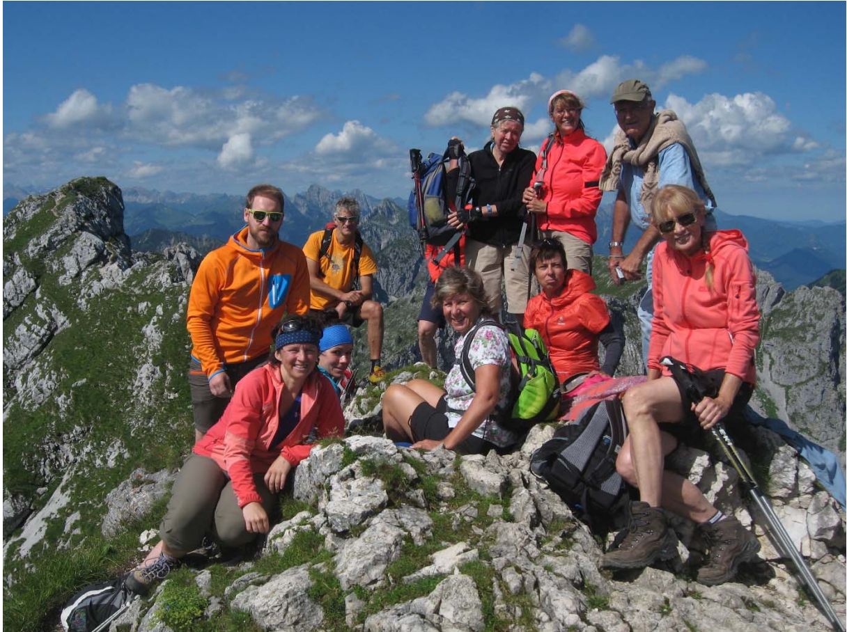
Tagestour Kompar (Karwendel) am 07.08.2016